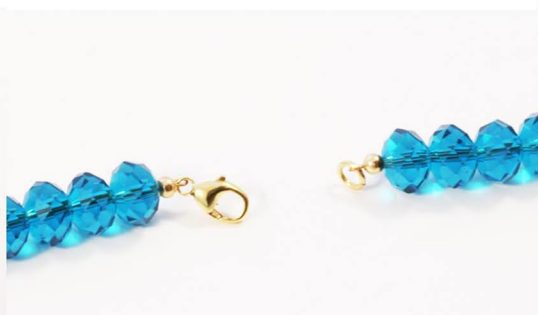
Afslut med crimp-bead som vist tidligere.