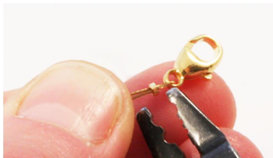
Wireklemmen klemmes til med tang.