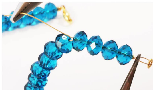
Før wire-enden tilbage gennem 3-4 perler. Stram til, så øjet med øsknen bliver mindst mulig.