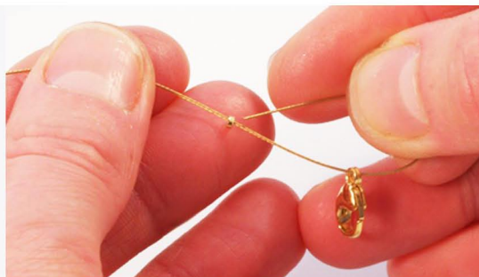
Wire føres gennem wireklemme, lås og tilbage.