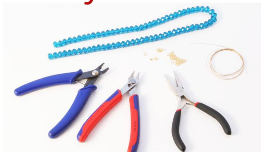
Wireklemmetang, bidtang, spids fladtang, Tigertail-wire, wireklemmer, karabinlås, perler.