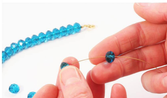
Perler trækkes på wire.