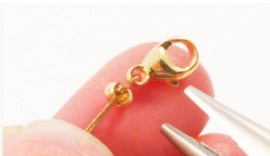
Crimp bead klemmes over wireklemme til pynt og for at skjule.